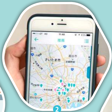
圖1至3：「旅行蹤」整合了旅行相關資訊，滿足了旅人的需求。