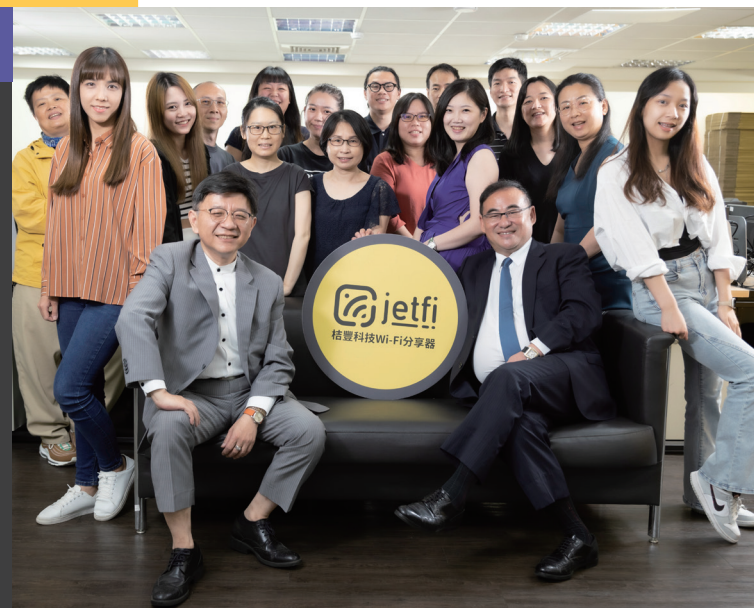
桔豐科技持續壯大團隊與產品服務能量，計畫在 2026 年在臺上市櫃。

桔豐科技 WiFi 機範圍涵蓋歐、美、亞、大洋洲及非洲，讓客戶環遊世界也能使用網路服務，為國內 WiFi 設備業的領導品牌，2023 年成功推出了一款獨特的 eSIM 產品，透過 APP 下載即可使用 eSIM 產品，無需使用傳統二維碼開通。