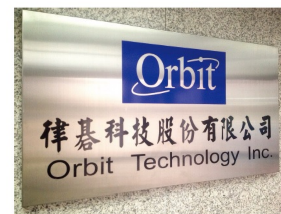
▲律碁科技股份有限公司

本計畫目標在提升大型停車場的管理效能，打造一個安全、尊榮與人性化的新世代「智慧型停車場」。整合自有的車牌辨識核心技術、車位在席偵測，同時開發創新技術，包括停車導引技術、尋車協助App、專屬特殊車位管理(殘障車位與VIP預約車位)、車輛保全與記錄影片查詢、緊急求助、影音對講及遠端監控等技術，全方位升級停車場友善服務模式，引領停車管理產業邁向精緻化、科技化與智慧化。透過本計畫開發完成的「智慧型大型停車場影像管理系統」，已在臺灣地區取得多項相關專利，並成功應用於：台北101大樓、台大兒童醫院、台南海安商圈等停車場，同時新成立“愛一起股份有限公司”，提供全方位的停車會員服務，未來將擴大應用至中國大陸及亞洲其他國家。