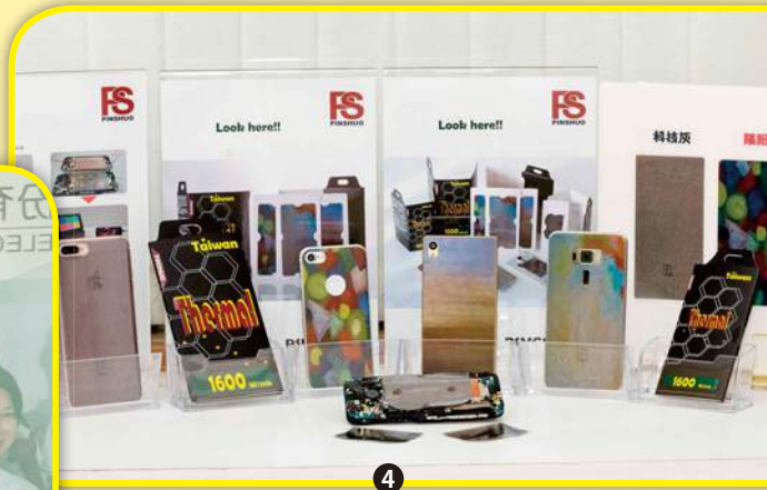
圖4、5：網狀石墨製成的散熱貼片，運用在鋰電池可增長電池本身壽命，且散熱功能更佳。