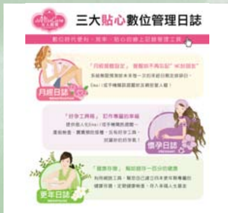
▲MissCare研發女性生理三大日誌照護女性一生