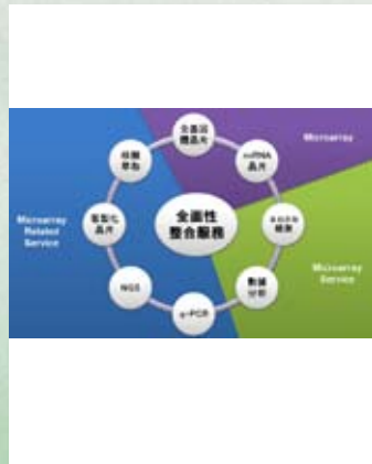
▲華聯全面性整合服務