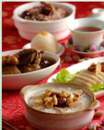
▲MissCae以「月經日誌」的虛擬服務，加上「香草美人生理餐」的實體產品，提供女性最佳的生理期照護方案